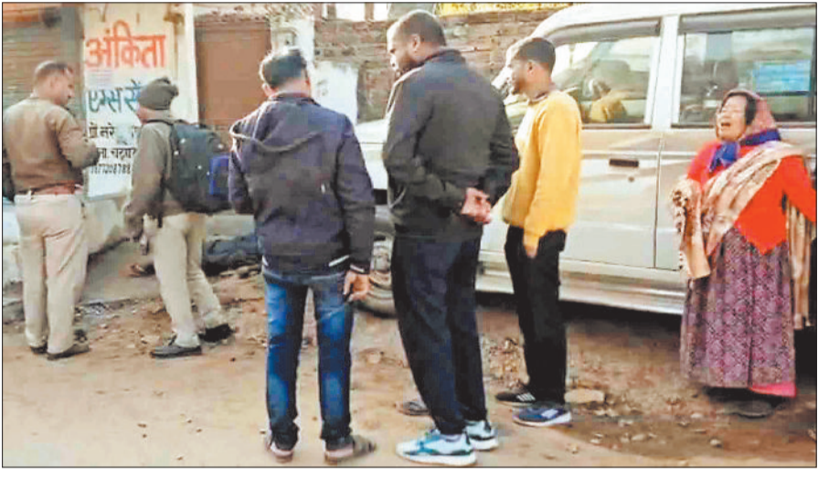
घटना स्थल की जांच करते पुलिस अधिकारी।

बता दें कि शनिवार की सुबह शहर के गांधीनगर डेयरी फार्म रोड पर सड़क किनारे एक व्यक्ति का शव स्थानीय लोगों ने देखा था। शव मिलने के बाद मामले की जानकारी पुलिस को दी गई। सूचना मिलने के बाद मौके पर पहुंची पुलिस ने मृतक की पहचान सुभाष नगर निवासी 46