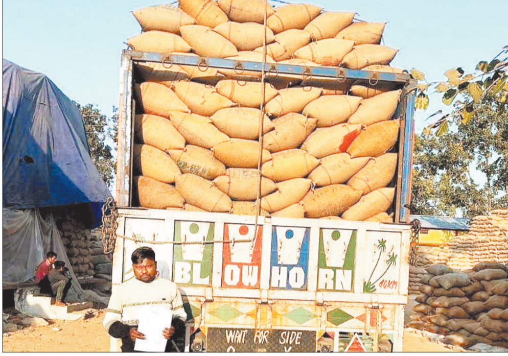
धान उठाव का कार्य जारी।

जानकारी के अनुसार केलहारी 24,420 क्विंटल, चैनपुर 14,890 क्विंटल, रतनपुर 9,820 क्विंटल, घुट्टा 8,000 क्विंटल, कठौतिया, 8,240 क्विंटल, नागपुर 5,980 क्विंटल, बरदर 2,830 क्विंटल, बंजी 2,450 क्विंटल, खड़गावां 1,940 क्विंटल, बरबसपुर, 1,800 क्विंटल का उठाव हुआ है। इसके अलावा कोडा, कुवांरपुर, जनकपुर और डोडकी उपाजन केन्द्रों से भी निर्धारित मात्रा में धान का उठाव किया गया है। कुछ केन्द्रों में फिलहाल धान उठाव शून्य है, लेकिन शेष धान उठाव के लिए सभी तैयारियां पूरी की जा चुकी हैं और आगामी दिनों में उठाव की गति और तेज की जाएगी। मुख्यमंत्री विष्णुदेव साय के मार्गदर्शन में धान उठाव केवल प्रशासनिक प्रक्रिया नहीं, बल्कि किसानों के विश्वास और हित से जुड़ा दायित्व माना जा रहा है। जिला प्रशासन नियमित समीक्षा बैठकों के माध्यम से प्रत्येक उपाजन केन्द्र की स्थिति पर सतत निगरानी रख रहा है, जिससे शेष धान का समय पर और सुरक्षित उठाव सुनिश्चित हो सके।